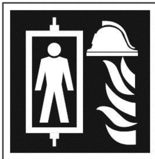
Приложение А (обязательное)